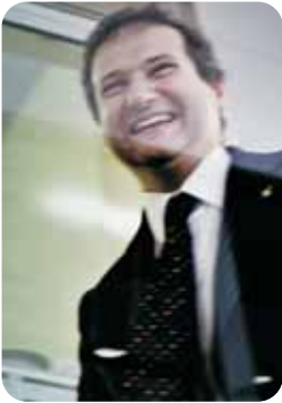
Jordi Hereu Alcalde de Barcelona